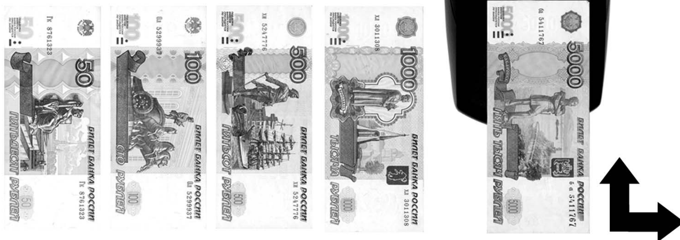
Рис.4 Ориентация банкнот при работе

Внимание! Если банкнота помещается в приемный лоток неправильно, то банкнота не признается подлинной и выдается любой код ошибки. При выпадении ошибки проверьте правильность ориентации банкноты Рис.4 и попробуйте еще раз поместить банкноту в приемный лоток. По окончании счета обнулите дисплей нажатием на кнопку "С" и выключите питание. Если банкнота застряла внутри детектора, откройте верхнюю крышку Рис 1 Поз 2 и удалите банкноту.